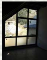
Finestral de l'estar-menjador