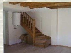
Escala d'accés a l'altell