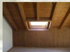
Sotacoberta a l'estar-menjador