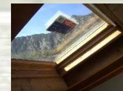
Vèlux a l'altell